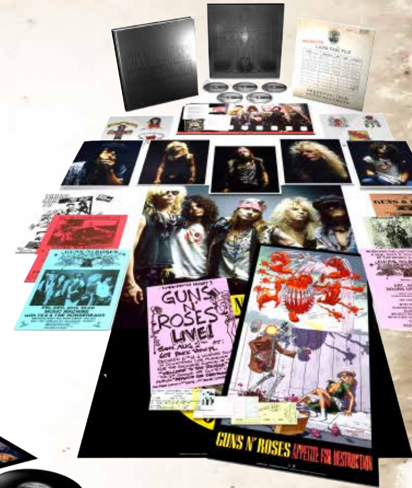
4CD+Bluray Super Deluxe