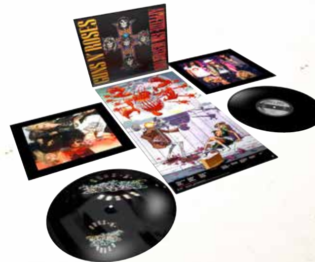
2LP Limited Edition