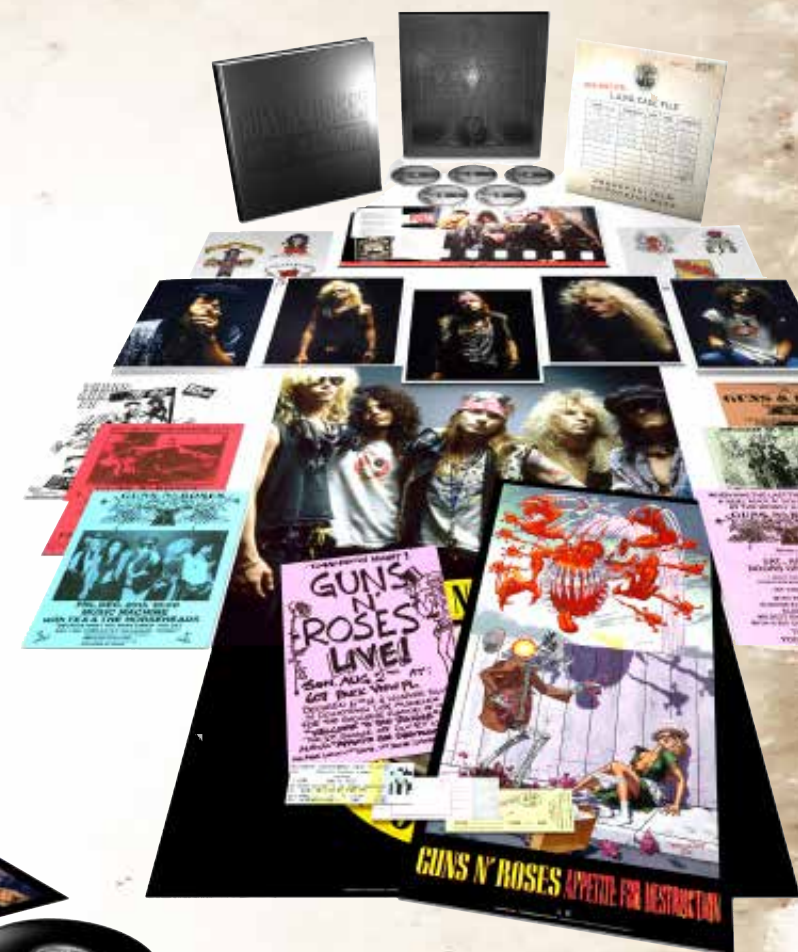
4CD+Bluray Super Deluxe