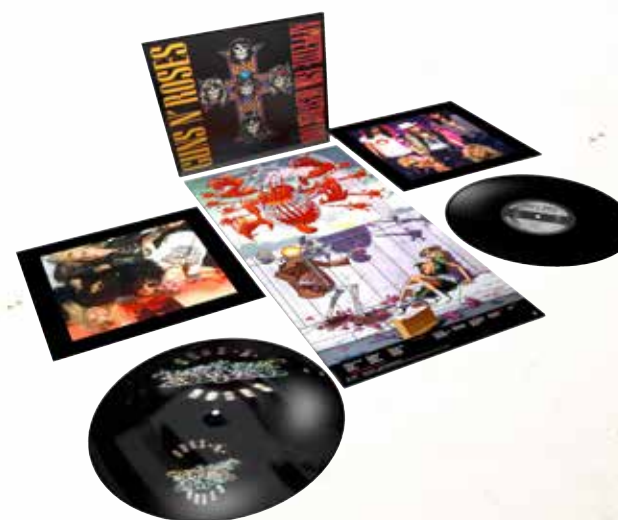
2LP Limited Edition